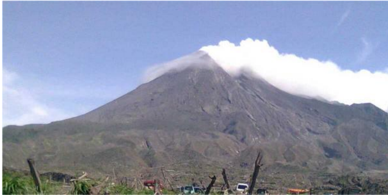
Gambar 3.2 Gunung Berapi